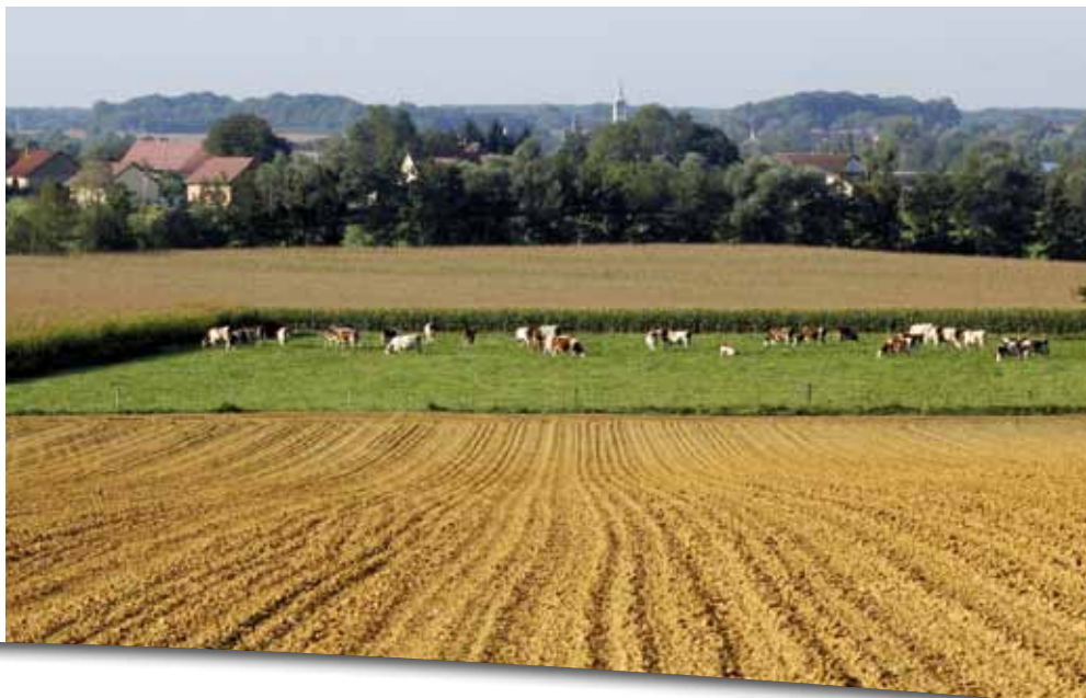
Une région de polyculture-élevage.