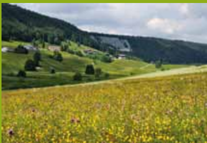
Prix des Jeunes Pousses pour une parcelle de Phanuel Lacroix à Bois d'Amont.