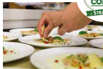
Le Comté, entre les mains de grands chefs venus de Strasbourg, de Lyon et du Jura.

L'événement est à revivre en images sur www.latableducomte.com .