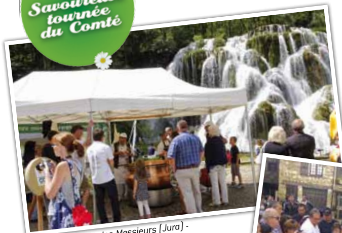
31 juillet : Baume-les-Messieurs (Jura) - Cascade des Tufs.

Cet été, la Savoureuse Tournée est partie sur vos lieux de vacances en Franche-Comté mais aussi dans l'Ain et en Alsace. Merci pour toutes ces belles rencontres... Et à l'année prochaine !