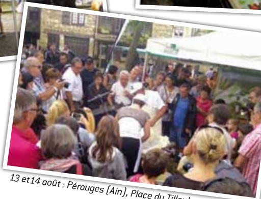
13 et 14 août : Pérouges (Ain), Place du Tilleul.