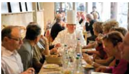
Une sommité mondiale de la gastronomie, le grand Emile Jung en personne, devant les heureux invités de la Table du Comté.