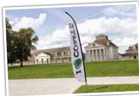
21 août : Salines Royales d'Arc-et-Senans (Doubs).