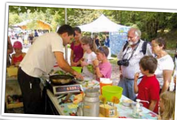
6 août : Cascades du Hérisson (Jura).