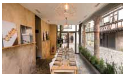
Le restaurant éphémère du Comté, installé à la Cour du Corbeau, monument remarquable au cœur du centre historique.