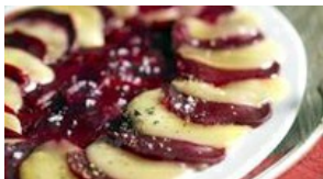
Carpaccio de betterave gratiné au Comté