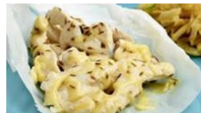
Papillotes de dinde au Comté et cumin