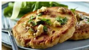
Galettes croustillantes de Saumon aux Noix et au Comté