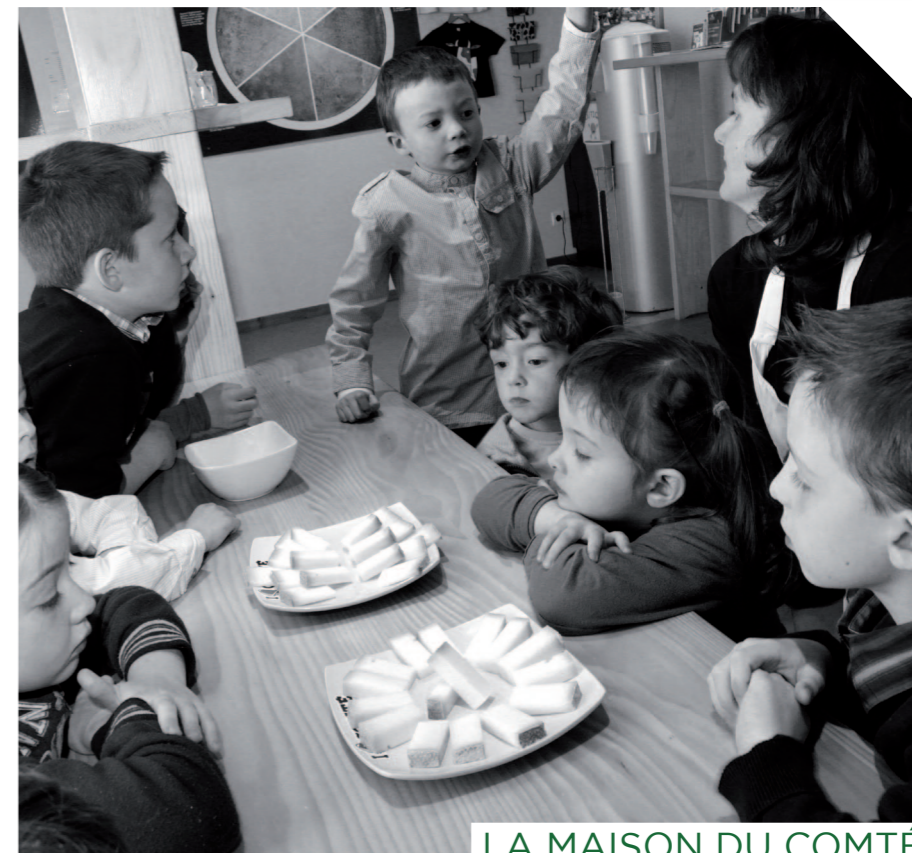
LA MAISON DU COMTÉ